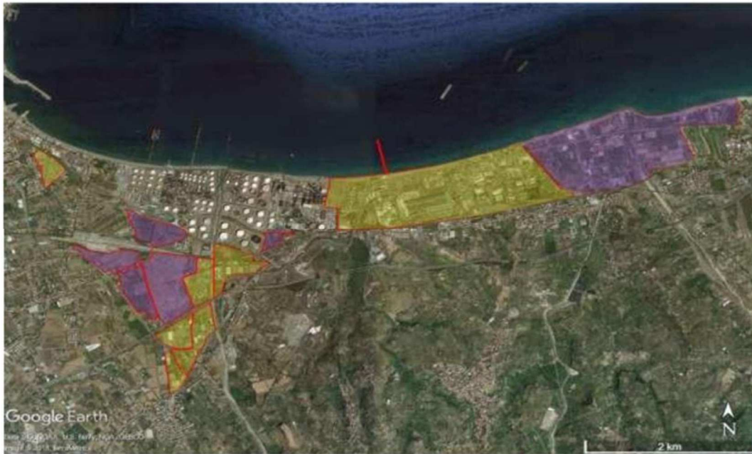
Agglomerato industriale di Milazzo