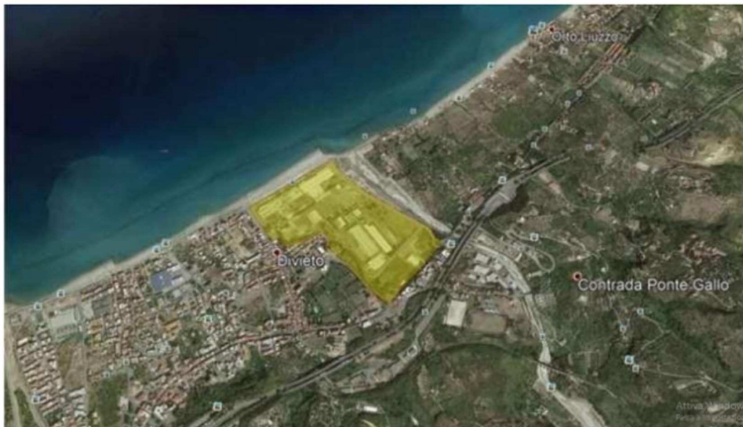
Agglomerato industriale di Villafranca Tirrena - zona 1

Sulla base di queste informazioni si sono costruiti dei perimetri geografici rappresentabili e navigabili delle zone ZES.